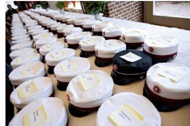
huen venter på dig, foto: ls

Studentereksamen aflægges i slutningen af 13. årgang og omfatter valgfrit enten 4 eller 5 eksaminer i forskellige fag: Første eksamensfag er profilfaget, andet og tredje eksamensfag er 2 af de 3 kernefag dansk, tysk og matematik efter eget valg. I første, anden og tredje eksamensfag aflægges eksamen som skriftlig eksamen. Fjerde eksamensfag afvikles enten som mundtlig eksamen eller som en såkaldt præsentationseksamen, hvor du efter en forberedelsestid på flere uger forelægger en