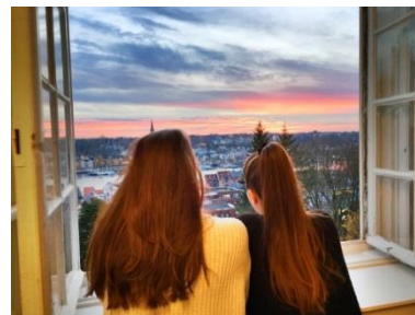
Duborg-Skolen: højt til loftet og frit udsyn

Tilmeldings- eller ansøgningskemaet afleveres (forudsat, at du er elev på en skole i Dansk Skoleforening for Sydslesvig) på din egen skole! Duborg-Skolen skal have skemaet senest 8.2.2018 . Er du ikke elev på en skole indenfor Dansk Skoleforening for Sydslesvig, sendes tilmeldings- eller ansøgningskemaet direkte til Duborg-Skolen. Relevante eksamensbeviser, fx F9-eksamen (ESA), F10-eksamen (MSA), folkeskolens eksamen og uddannelsesparathedsvurdering, samt relevante karakterudskrifter, fx fra F10, fra folkeskolen, fra efterskolen, vedlægges.