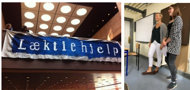
Duborg-Skolen er ikke kun undervisning i timerne, men også lektier – så er det godt, at der er lektiehjælp, hvor lærere hjælper eleverne videre, og FETE – "fra elev til elev", hvor eleverne hjælper hinanden med opgaverne

Skolen vil bestræbe sig på, at optage dig i én af de tre profiler, som dine prioriterede ønsker angiver – og selvfølgelig tage hensyn til din prioritering af disse ønsker.