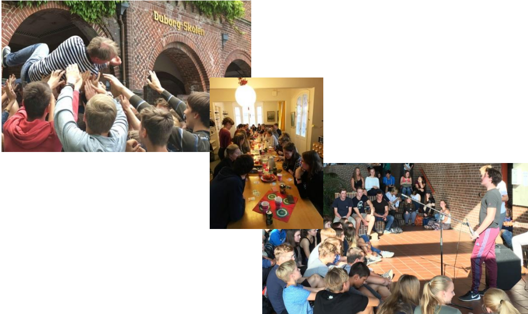
Duborg-Skolen er også fed musik, fredagscafé og fællesskab

Forudsætning for optagelse i idrætsprofilen er en speciel helbredsundersøgelse (som skal gennemføres efter ansøgningen, men før starten i 11. årgang). Du vil senere i løbet af optagelsesproceduren få nærmere informationer herom.