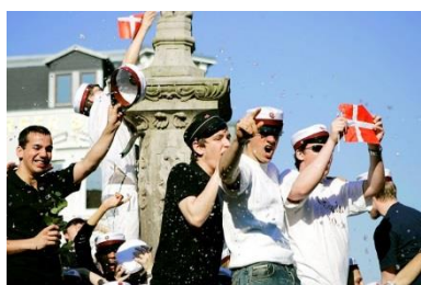
fest og glæde med studenterhuerne

Profilgymnasiet på Duborg-Skolen er organiseret med udgangspunkt i den relevante slesvig-holstenske bekendtgørelse, OAPVO fra 2.7.2007 med senere ændringer samt en beslutning i Skoleforeningens Styrelse om bl.a. udbud af profiler og fag-/timefordeling i profilerne.