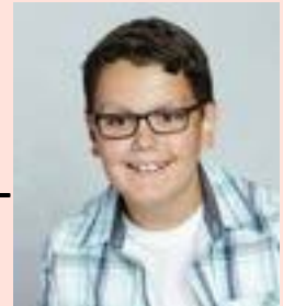
Af Leon Bossen, 8. årgang

Hovedårsagen for skabelsen af Smart Guns er den fortsatte uro omkring politibetjentes nedskydning af den ubevæbnede sorte teenager Michael Brown i USA. Smart