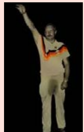
Fra de racistske optøjer i Rostock, 1992

vi lade være med at optage flygtninge fra Afghanistan, Irak eller Syrien, fordi vi ikke gider at betale for dem, eller fordi der er nogen, der reagerer negativt på vores verden? Selvfølgelig IKKE! Europæerne er forpligtet til optagelsen af flygtningene, og hvorfor? Fordi europæerne selv har blod på hænder-